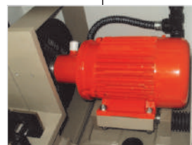
Mecanismos de morsas e bicos direcionáveis