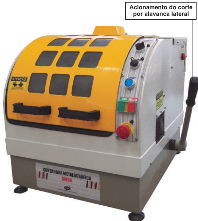
Acionamento do corte por alavanca lateral