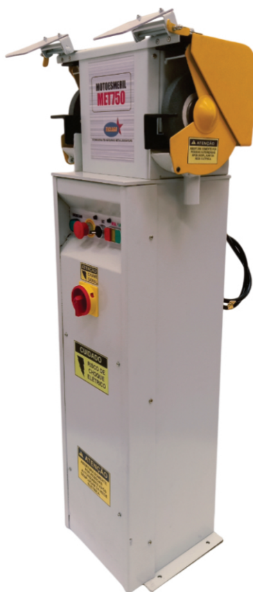
Guarnições de proteção do rebolo