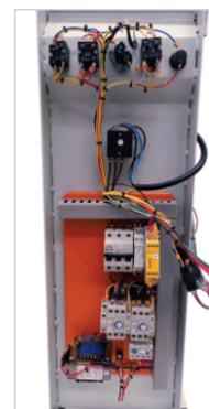
Elétrica adequada a NR-10 e NR-12