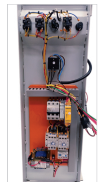
Elétrica adequada a NR-10 e NR-12