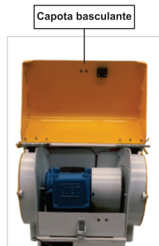
Possui duto para acoplar exaustor