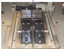
Mesa móvel com dois fusos e movimento transversal de 50mm (opcional)