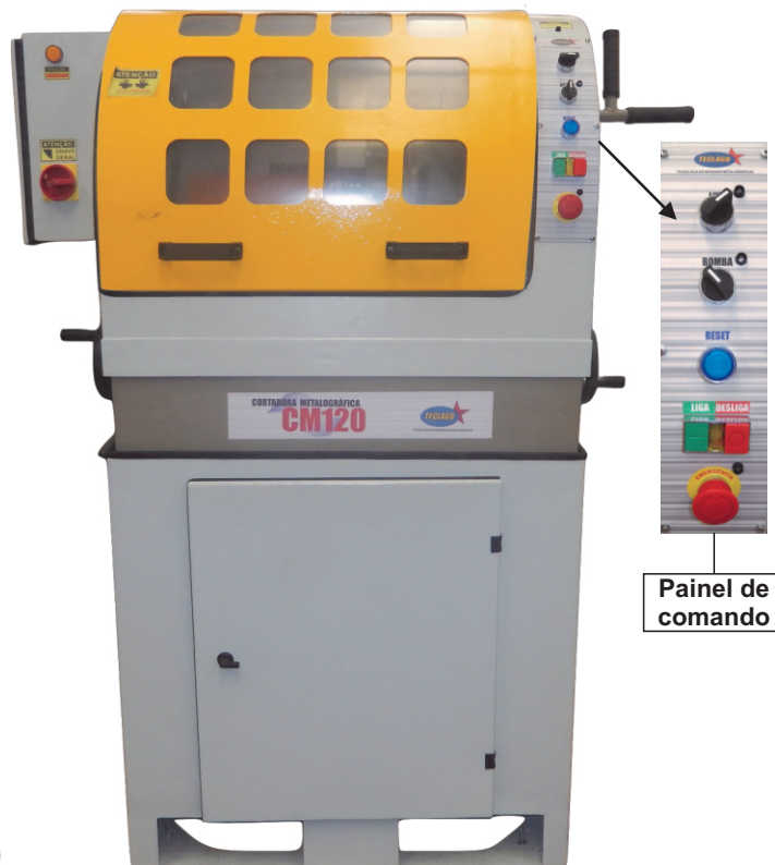
Painel de comando